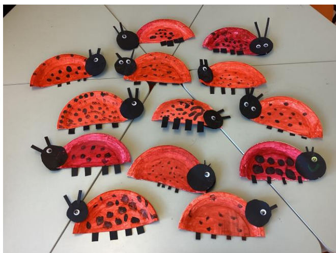
Vi lagde marihøner i kunst og håndverk 😊